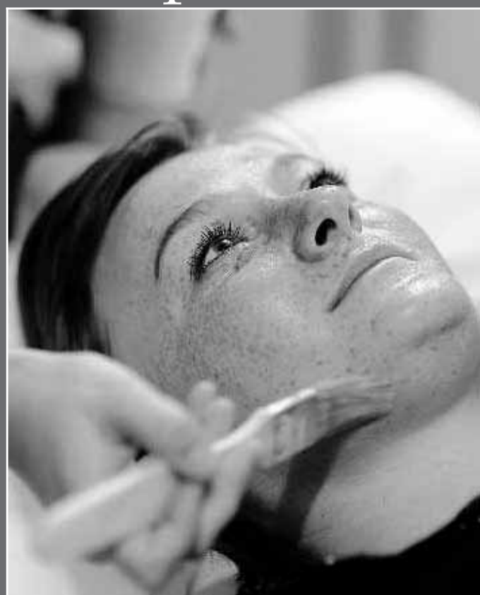
■ Voor het plaatsen van de naalden wordt een masker aangebracht.

vervolgens kan opdrinken voor een intenser effect.